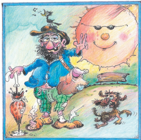
un sorriso..alla Vita !