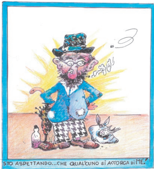
STO ASPETTANDO...CHE QUALCUNO SI ACCORGA DI ME!