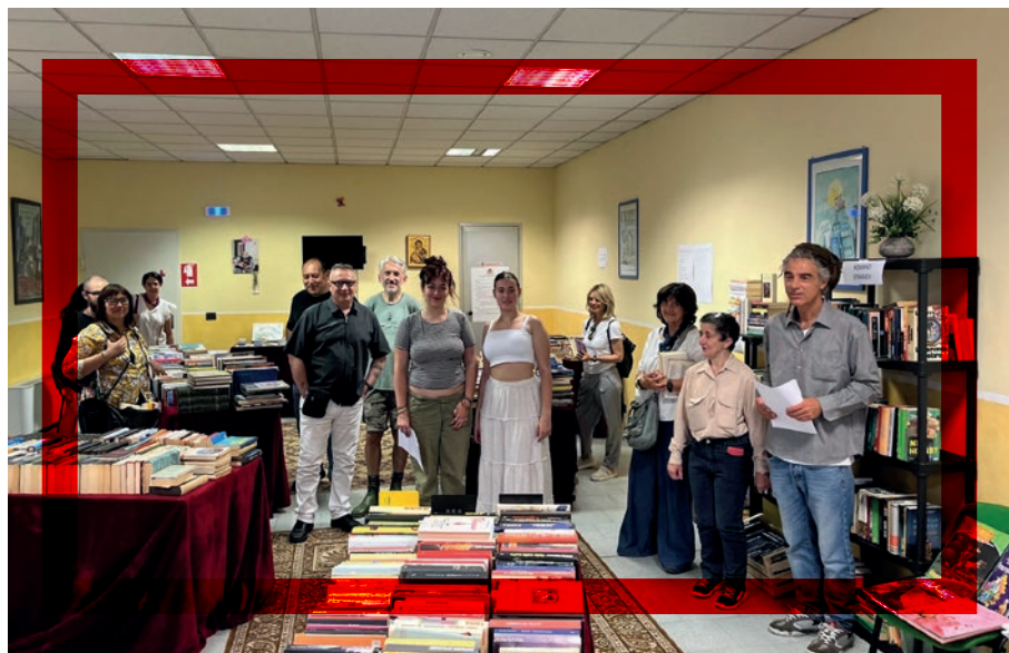
Premiazione concorso letterario "Lia Varesio"

— Considerata la situazione davvero critica che tutti stiamo vivendo, con il continuo aumento del costo degli alimenti, delle utenze e di ogni prodotto, rivolgiamo un accorato appello a chi può a sostenere la Bartolomeo con offerte, in quanto i costi delle 11 case, del dormitorio e della nuova accoglienza "Casa Lia" in cui accogliamo le persone più bisognose, stanno crescendo esponenzialmente e non vogliamo essere costretti a chiudere delle case, ma vogliamo continuare a stare dalla parte degli ultimi, come ci ha insegnato la nostra fondatrice Lia.